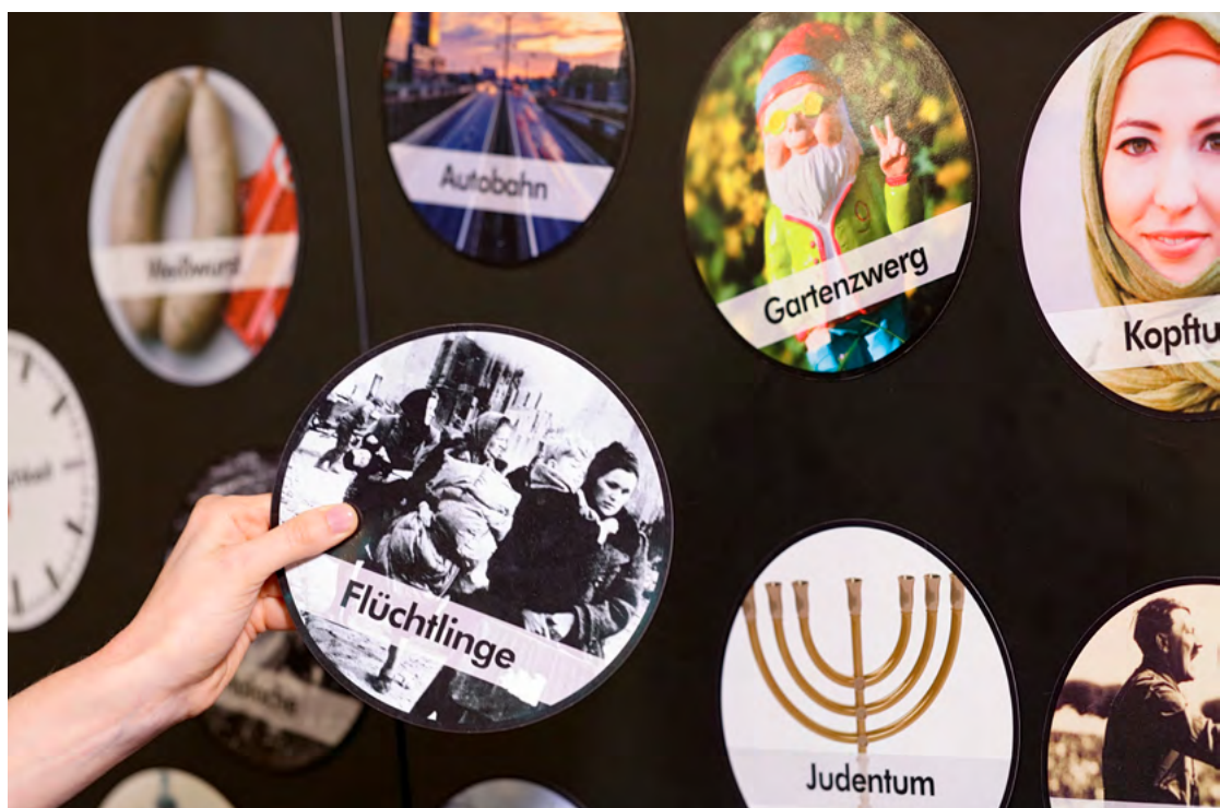
Zentrum für Erinnerungskultur Duisburg, Workshop „Was ist Deutsch?“

Diese unterschiedlichen Erinnerungserzählungen, die oft parallel zum Erinnern in der Stadt existieren, sollten im öffentlichen Diskurs Eingang finden. Anstelle einer Engführung des Geschichtsbewusstseins entlang von Herkunftsn sollte dabei die gegenseitige Bereitschaft zu aktivem, wertschätzendem Dialog treten. Hierzu können insbesondere partizipationsorientierte Formate mit migrantischen Akteurinnen und Akteuren sowie Migrantenselbstorganisationen dienen. Diese sollten die Folgen diskriminierender oder rassistischer Haltungen mitreflektieren. Das dient sowohl der Anerkennung einer von Diversität geprägten Gesellschaft als auch der Stärkung unserer Demokratie.