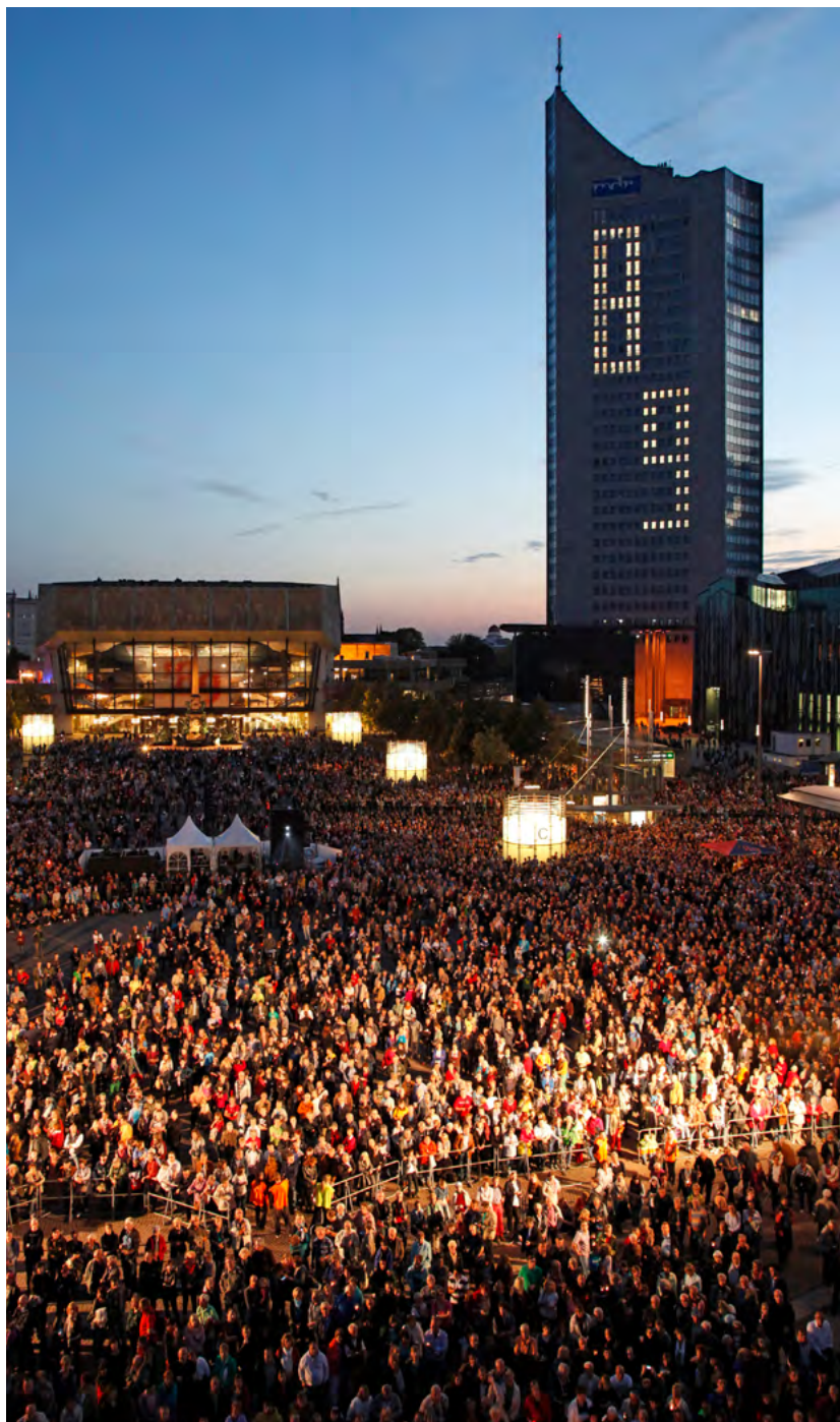
Lichtfest Leipzig, alljährlich am 9. Oktober

Als Antwort hierauf erschließen die Städte derzeit Räume für einen zukunftsweisenden Diskurs über Demokratie und Menschenrechte. Die urbane Vielfalt eröffnet die Chance, das öffentliche Erinnern als einen dynamischen, teils ergebnisoffenen Prozess erfahrbar zu machen. Insgesamt beantworten die Städte die jüngsten Herausforderungen somit überwiegend durch Weiterentwicklung vorhandener Erinnerungskonzepte. Über die Entwicklung von Neuansätzen in einzelnen Städten hinaus erscheint es sinnvoll, gemeinsame Leitlinien für die Erinnerungskultur in der Stadt zu formulieren und sie in die Weiterentwicklung kommunaler Konzepte einzubinden. Der Kulturausschuss des Deutschen Städtetages hat deshalb eine Arbeitsgruppe eingerichtet. Diese hat sich über bereits vorhandene Erinnerungskonzepte ausgetauscht und auf dieser Basis das vorliegende Papier entwickelt.