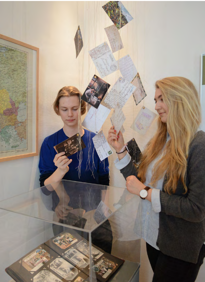
Stadtarchiv Neuss, Ausstellung „Gottvertrauen und Gehorsam. Neuss im Ersten Weltkrieg“

Empathiefähigkeit muss Erkenntnis ergänzen, wenn aus der Erinnerung eine innere Haltung sowie die Fähigkeit zum Handeln erwachsen soll. Tatsächlich reicht Wissen allein nicht aus, um entsprechende Wirkung zu entfalten. Fakten müssen sowohl kognitiv als auch emotional durchdrungen werden. Eine wichtige Rolle nimmt dabei die Zeitzeugenarbeit ein.