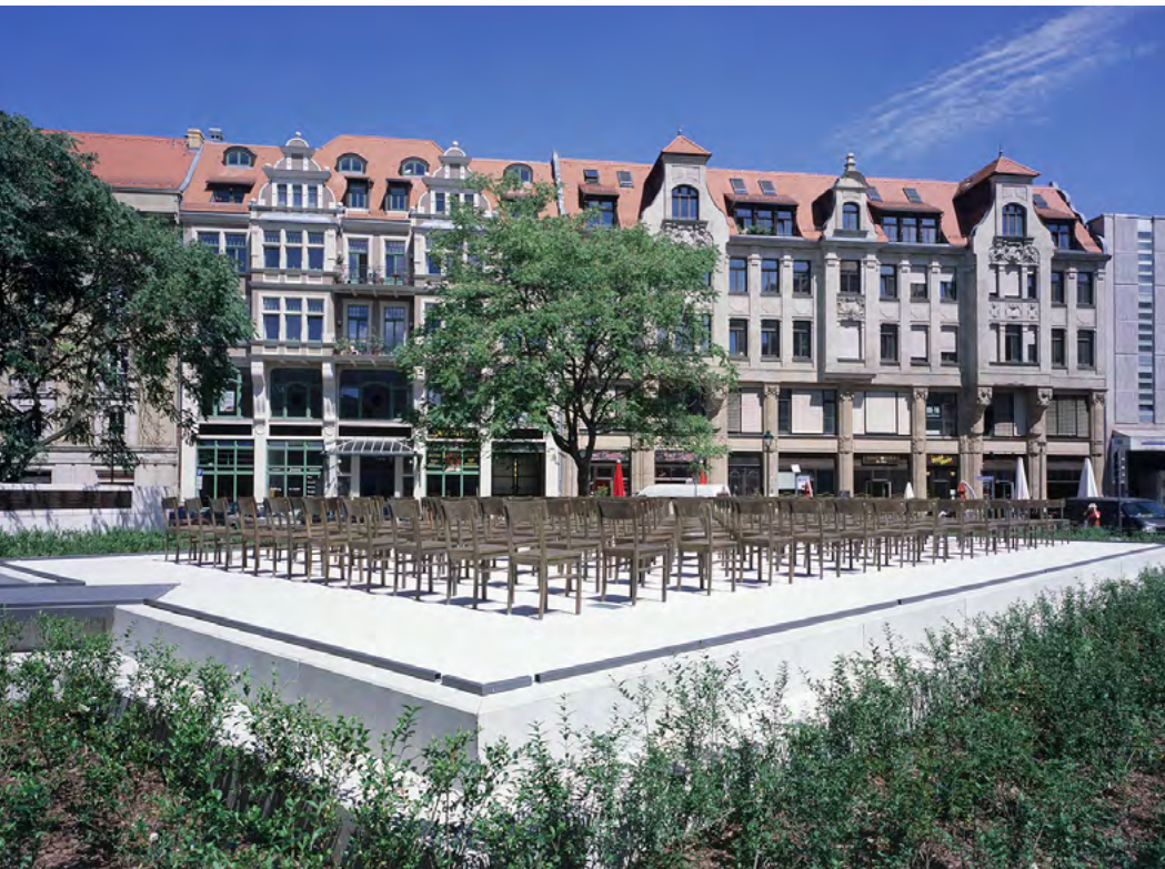
Gedenkstätte am Ort der Großen Gemeindsynagoge, Leipzig

Neben nationalsozialistischen Verbrechen und (anti-)demokratischen Entwicklungen gibt es weitere Erinnerungserzählungen in der Stadt, die es aufzuarbeiten gilt. Für viele Städte ist die Aufarbeitung des SED-Regimes und der DDR-Geschichte ein prägender Teil