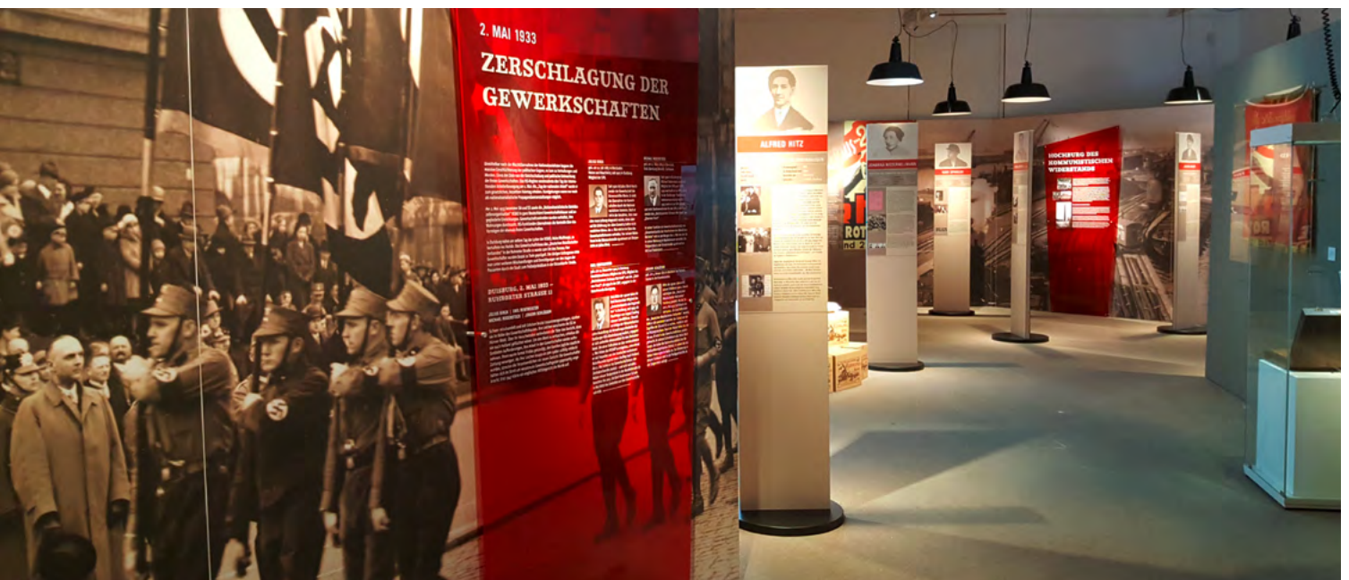
Kultur- und Stadthistorisches Museum Duisburg, 2017/18, Ausstellung „Das rote Hamborn – Politischer Widerstand in Duisburg von 1933 bis 1945“

In kommunalen Einrichtungen der Erinnerungskultur wird ein wesentlicher Teil des städtischen Gedächtnisses bewahrt. Sie sind zentrale Orte kommunaler Selbstvergewisserung. Zugleich sind es Einrichtungen zur Förderung kritischen Geschichtsbewusstseins auf Basis authentischen Wissens. Durch die Aufbereitung aktuell relevanter Themen in Form von Ausstellungen und Veranstaltungsreihen können sie als politisch-historische Seismographen in der Stadtgesellschaft dienen.