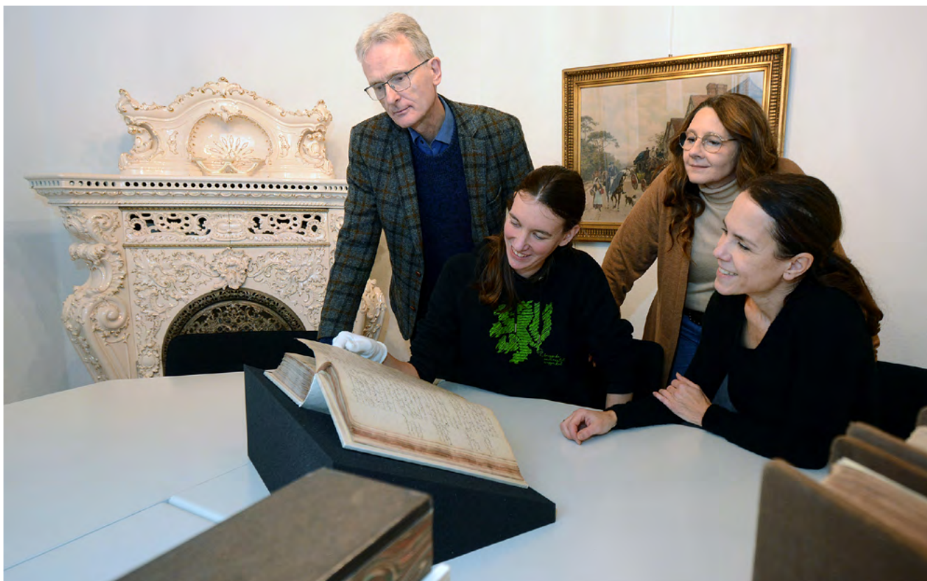
Stadtarchiv Neuss, Citizen Science Projekt – „Consilium Communis“