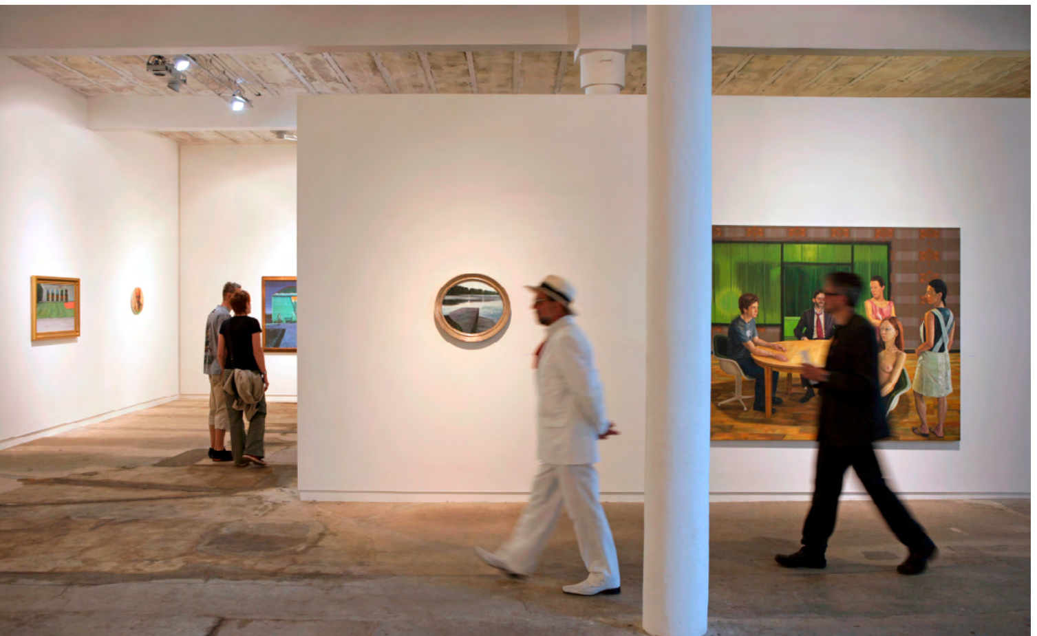
Produktions- und Ausstellungsstätte für zeitgenössische Kunst und Kultur in Europa (ehemalige Baumwollspinnerei), Leipzig