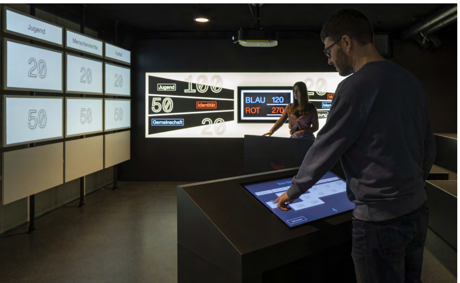
MARCHIVUM Mannheim, Quiz „Democracy“ in der NS-Ausstellung

(Inter-) Kommunale Veranstaltungsreihen in Zusammenarbeit unterschiedlicher Kultur- und Bildungseinrichtungen zu übergreifenden Themen können stadtgesehliche Auseinandersetzungen mit dem öffentlichen Erinnern anstoßen. Voraussetzung hierfür ist ihr „atmender“ Charakter. Breite Bevölkerungsgruppen werden dann erreicht, wenn Veranstaltungen aktuelle Bezüge aufweisen, die in unterschiedlichsten Formaten, von Diskussionen und Performances bis hin zu Ausstellungen und Aufführungen, fortgesetzt werden. Zugleich ist es zielführend, dass solche Reihen von zivilgesellschaftlichen Initiativen unterstützt werden. Begleitende historisch-politische Bildungsarbeit in unterschiedlichen Einrichtungen, die Schaffung neuer Jugendzentren als Orte des Austauschs oder auch Umbenennungen im öffentlichen Raum können die öffentliche Wahrnehmung positiv beeinflussen.