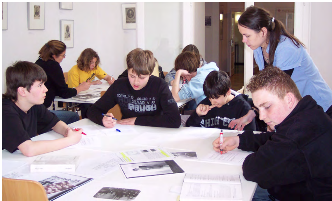
Stadtarchiv Neuss, Arbeit von Jugendlichen an historischen Quellen