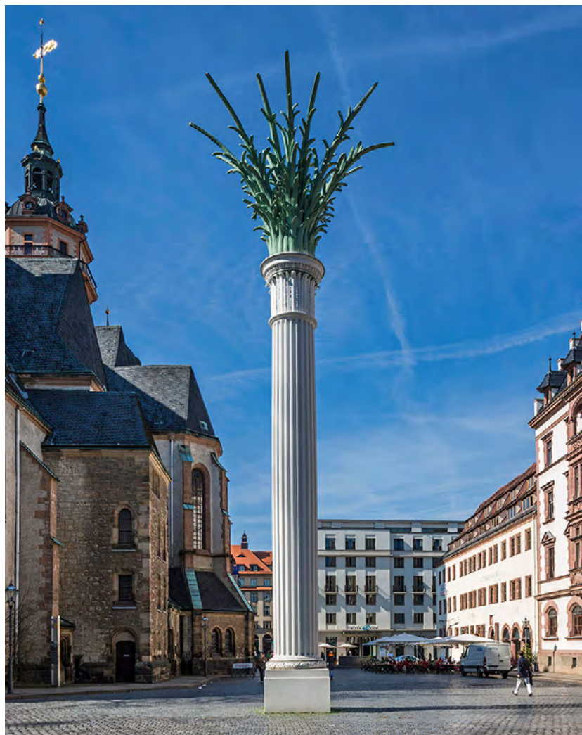
Nikolaisäule im Nikolaikirchhof, Leipzig

Dies unterstreicht den hohen Stellenwert von Denkmalschutz und Denkmalpflege. Ihnen kommen der gesetzliche Auftrag und die kulturelle Aufgabe zu, denkmalwerte Bauten und Anlagen, Strukturen und Gärten zu erfassen, wissenschaftlich zu erforschen, zu schützen und gemeinsam mit ihren Eigentümerinnen und Eigentümern zu pflegen und behutsam fortzuentwickeln.