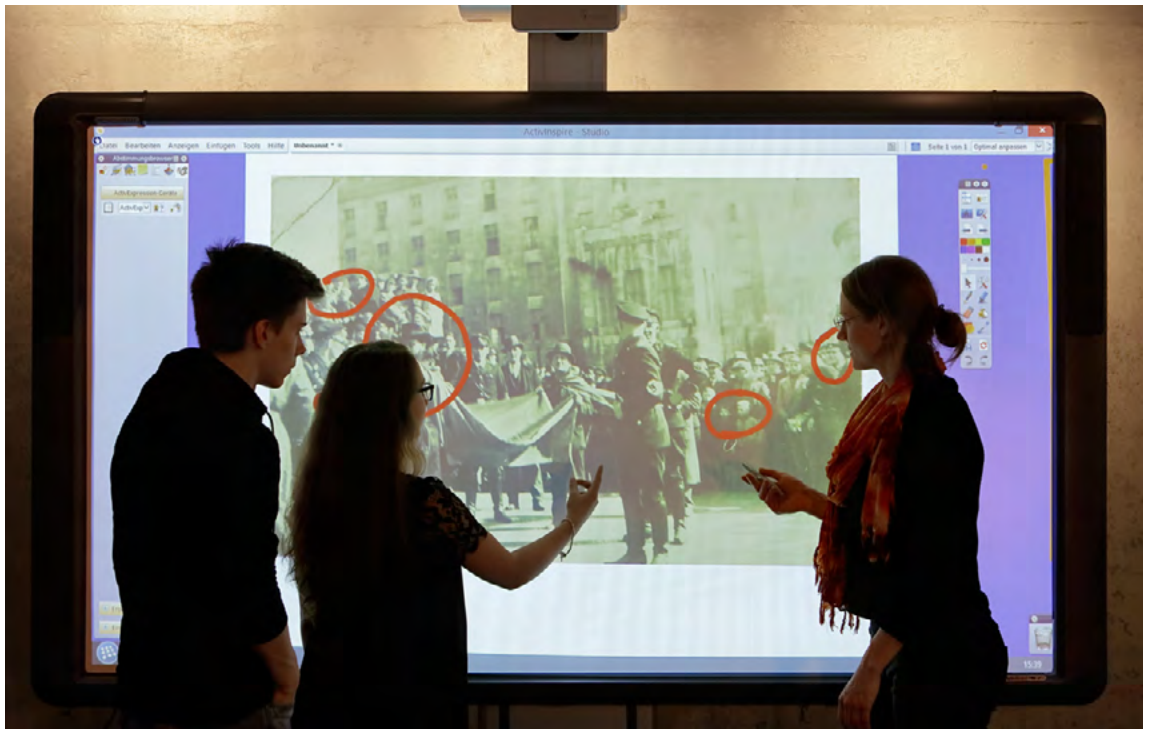
Zentrum für Erinnerungskultur Duisburg, Bildanalyse zu antisemitischen Ausschreitungen 1933

Die digitale Transformation beeinflusst auch die Erinnerungskultur. Während einerseits die Digitalisierung die Arbeit der Einrichtungen selbst durchdringt und erhebliches Entwicklungspotential bietet, findet andererseits die Auseinandersetzung mit Geschichte immer stärker auf elektronischem Weg, beispielsweise in sozialen Medien und Computerspielen, statt. So beschreiten kommunale Einrichtungen der Erinnerungskultur neue Wege zur digitalen Sicherung, (Langzeit-)Archivierung und Bereitstellung von Unterlagen und Objekten. Hierdurch wird ein Großteil der historischen Forschung allgemein, ubiquitär und losgelöst von Institutionen direkt verfügbar. Sie nutzen digitale Formate zur Entwicklung innovativer, zielgruppenspezifischer Bildungsformate, die von digitalen Ausstellungen bis hin zu Augmented-Reality-Formaten reichen. Diese regen zur Mitarbeit an und fördern die Eigeninitiative. Damit versteht sich Digital memory nicht nur als Ergänzung, sondern als eigenständiger Beitrag zur Erinnerungskultur in der Stadtgesellschaft.