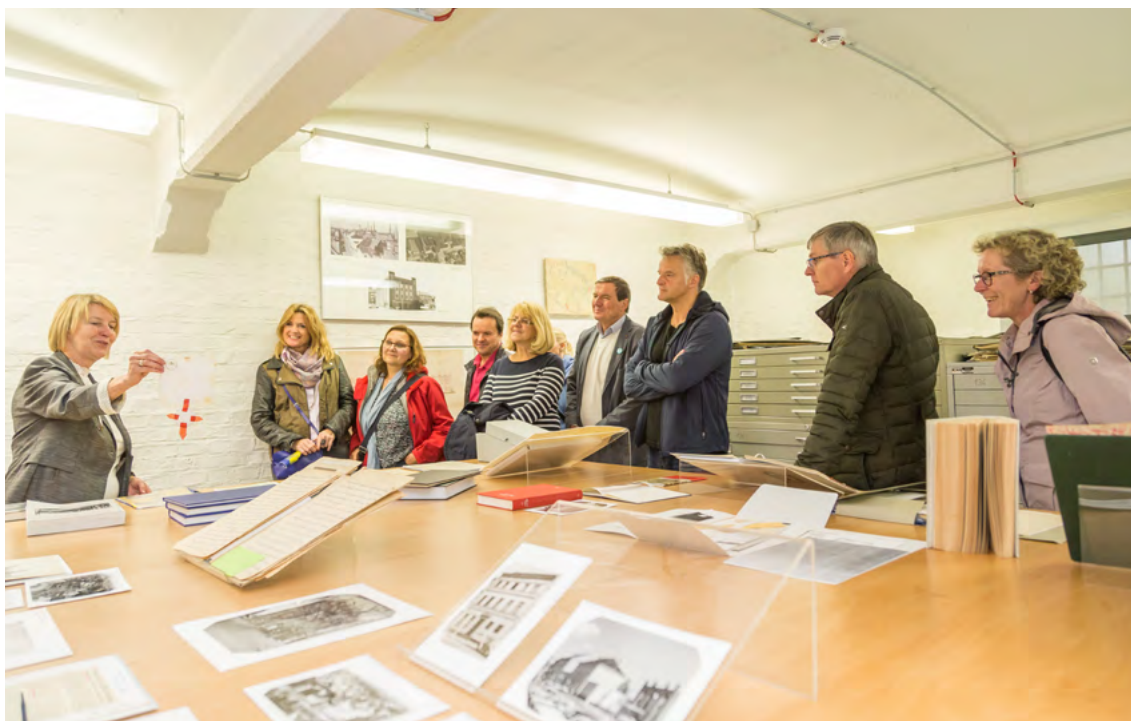
Stadtarchiv Neuss, stadtgeschichtliche Führung

Ein wesentlicher Ausgangspunkt städtischer Erinnerungskultur ist ein fundiertes historisches Wissen. Es wird in Angeboten historisch-politischer Bildung vermittelt. Zugleich ist Erinnerungskultur integraler Bestandteil kultureller Bildung und lebenslangen Lernens. In Museen, Archiven, Bibliotheken und anderen Einrichtungen wird nicht nur das historische Bewusstsein von Stadtbewohnerinnen und -bewohnern geschärft. Hier wird Geschichte zugleich als wesentlicher Bestandteil kultureller Selbstvergewisserung erfahrbar gemacht. Wesentlich ist, erinnerungskulturelle Formate noch stärker in kommunalen Gesamtkonzepten kultureller Bildung zu verankern. Erinnerungskultur ist gemeinsame Aufgabe von Kultur- und Bildungseinrichtungen, von Schule, Schulsozialpädagogik, Jugendhilfe, Denkmalpflege sowie von Kulturakteurinnen und -akteuren.