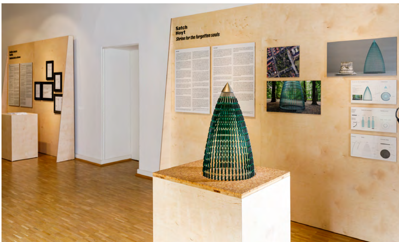
Städtisches Museum Braunschweig 2023, Entwurfspräsentation „Decolonizing Public Space“

Eine zeitgemäße „Erinnerungskunst“ zielt somit nicht auf reine Traditionsbildung, nicht nur auf Kenntnisse, sondern insbesondere auf Erkenntnisse. Die Reflexion des Betrachters macht die eigene Geschichtlichkeit bewusst und schafft Raum für erinnerungskulturelle Fragen. Mit den Mitteln der Kunst können historische Selbstverständnisse und deren geschichtliche Perspektiven kommentiert, kontrastiert und ergänzt werden. Dabei reagieren künstlerische Medien auf bestehende Ritualorte sichtbar und unmittelbar. Sie können aufgrund ihrer gesellschaftlichen Aktualität von hoher Wirksamkeit sein. Zugleich ermöglicht die sinnliche Erfahrung den Zugang zu emotionalen Tiefenschichten des Erinnerns. Vielstimmige und anhaltende Debatten um ein zeitgemäßes Erinnern auszulösen, ist damit eine Kernaufgabe von „Erinnerungskunst“ in der Stadt.