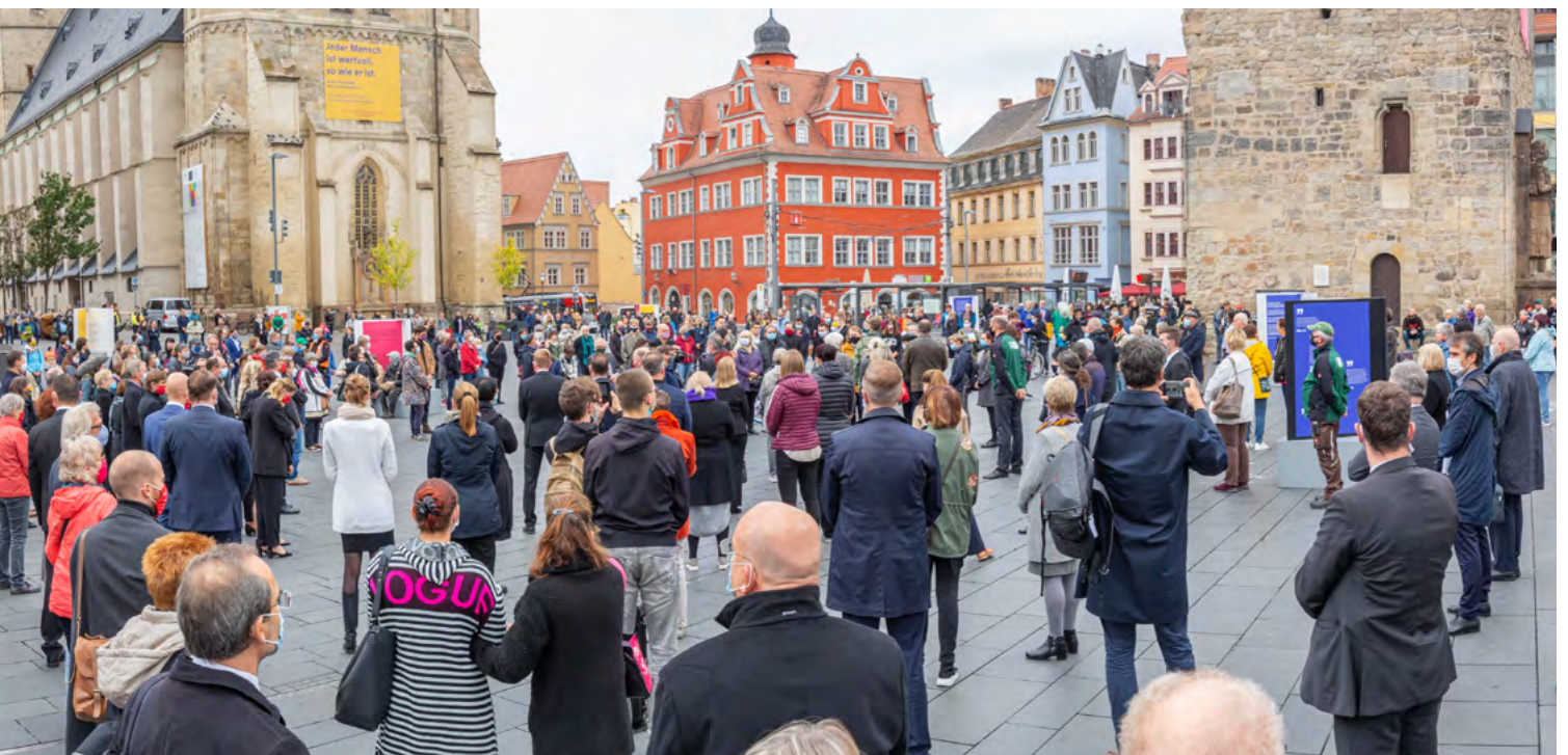
Markplatz Halle (Saale) 2020, Gedenken an das Attentat auf die jüdische Gemeinde am 09.10.2019

Eine besondere Herausforderung im Zusammenhang mit gesellschaftlicher Partizipation besteht im Umgang mit aktivistischen Strömungen, die ein mehrdeutiges, pluralistisches Remembern ablehnen. Demokratische Erinnerungskultur muss hinreichend diskursstark sein, um autoritären Strömungen entgegenzuwirken. Hinsichtlich der Vereinnahmung des Rememberns auch durch populistisch-extremistische Strömungen gilt es, Politik und Verwaltung, ebenso wie Versammlungsbehörden und Zivilgesellschaft verstärkt zu sensibilisieren und in ihrer aktiv demokratischen Haltung zu unterstützen.