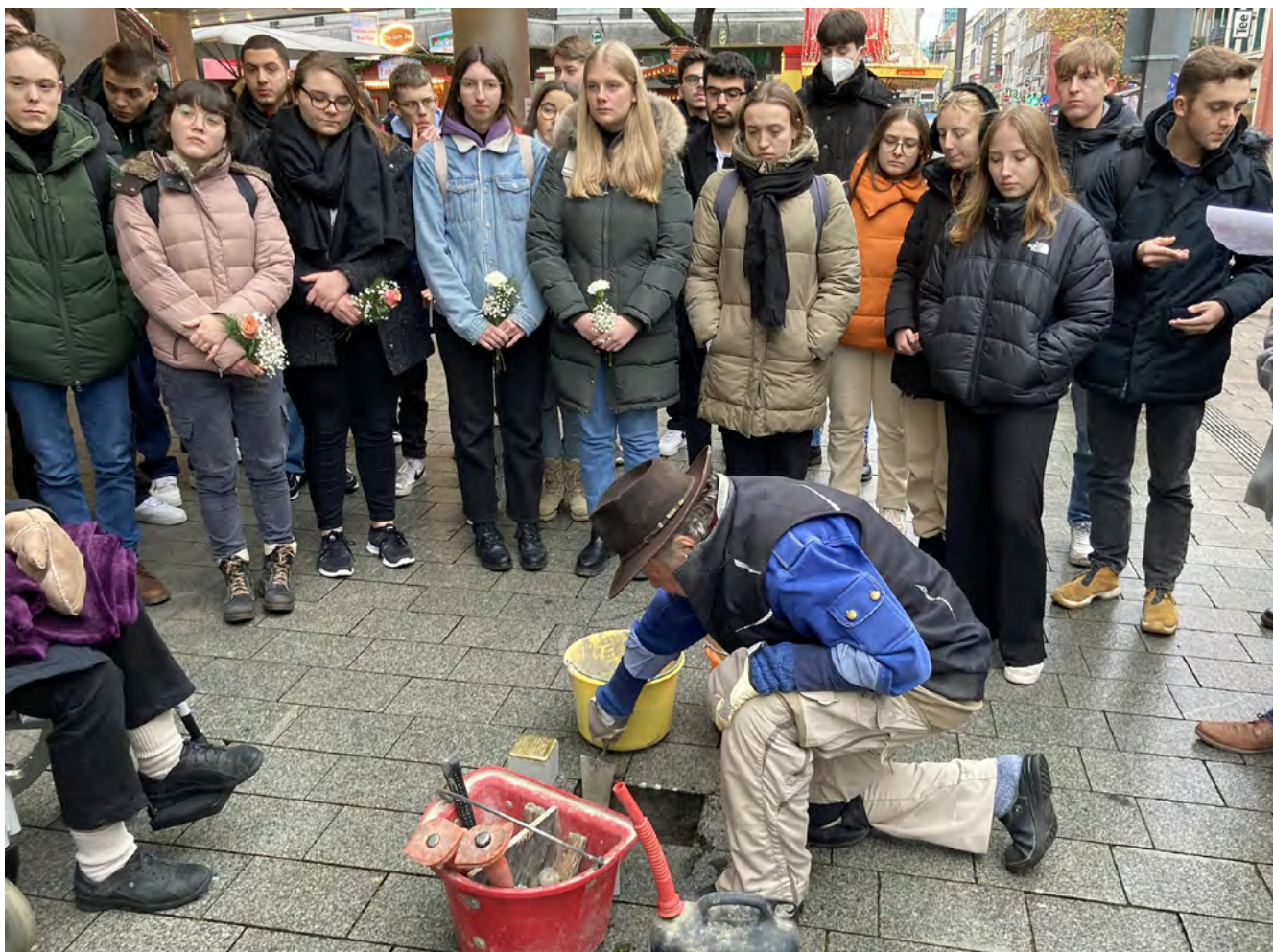
Verlegung von Stolpersteinen in Neuss 2022

Aus vorgenannten Aspekten ergeben sich folgende Handlungsfelder :