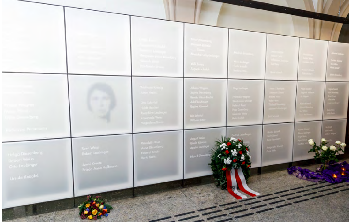
Foyer des Rathauses Braunschweig (Platz der deutschen Einheit), Erinnerungsstätte für verfolgte und ermordete Braunschweiger Sinti und Sintize